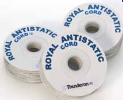
КАТУШКА 25 МЕТРОВ ROLLS OF 25 METRES