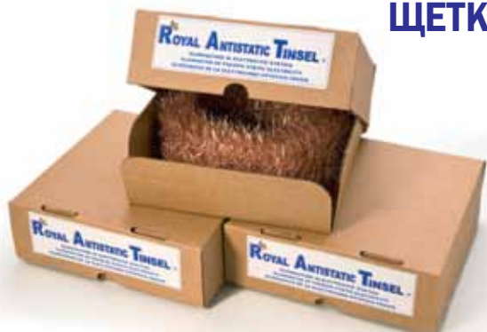
КОРОБКА 22 МЕТРАИ BOXES OF 22 METRES